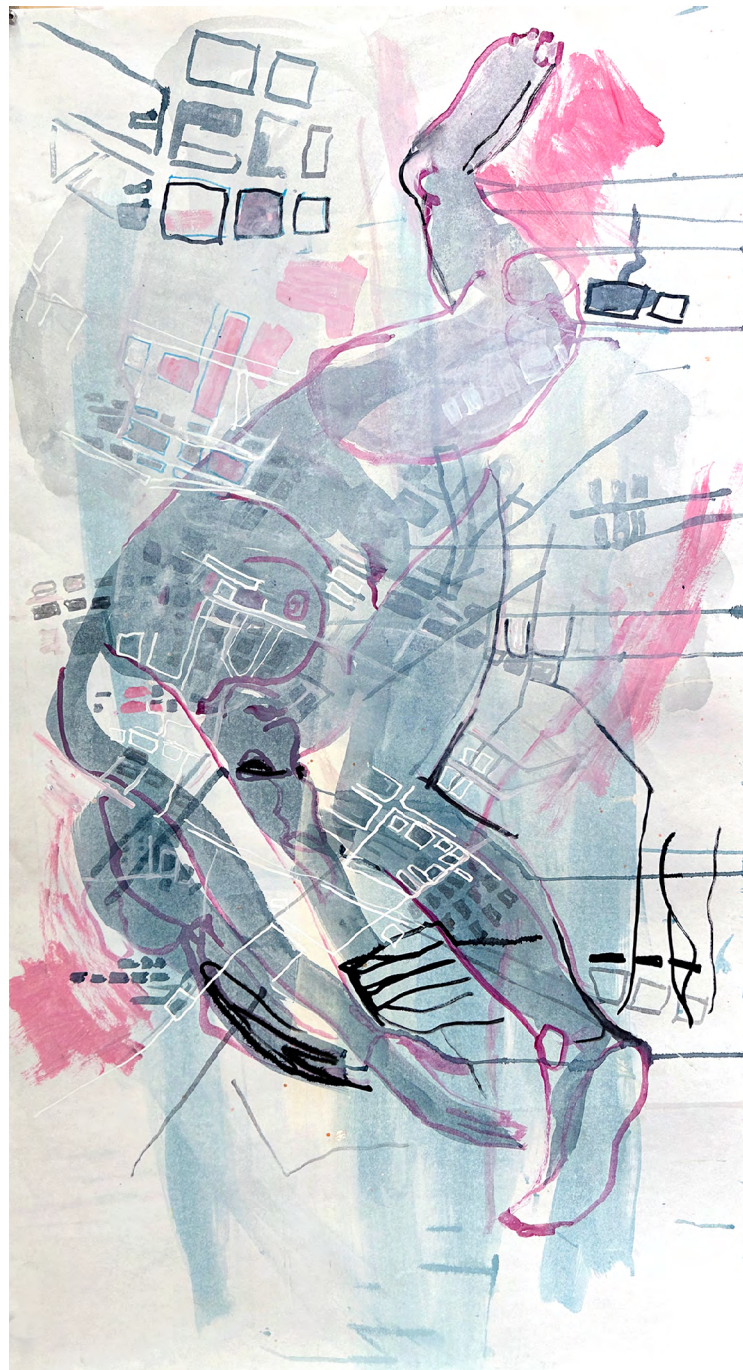
Plus d'une Ligne - Mardi, 75 x 150 cm (Tusche, Kohle auf Papier)