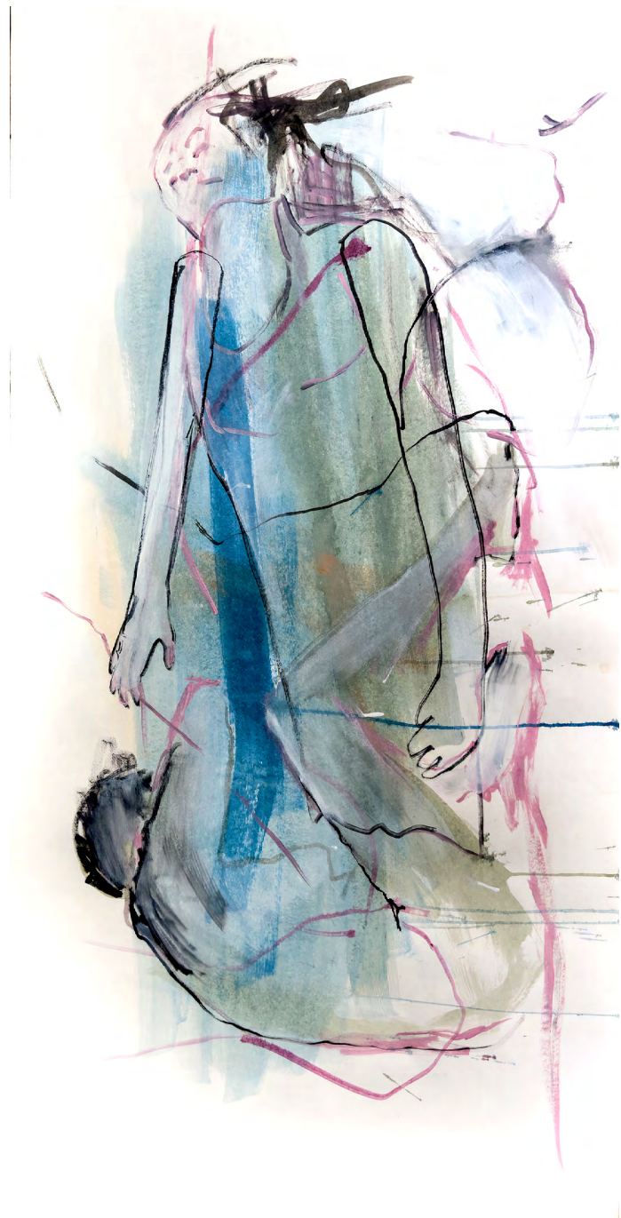
Plus d'une Ligne – Lundi, 75 x 150 cm (Tusche, Kohle auf Papier)