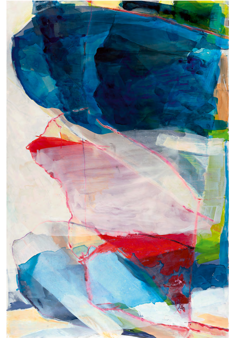
AlpStreich, 115 x 130 cm